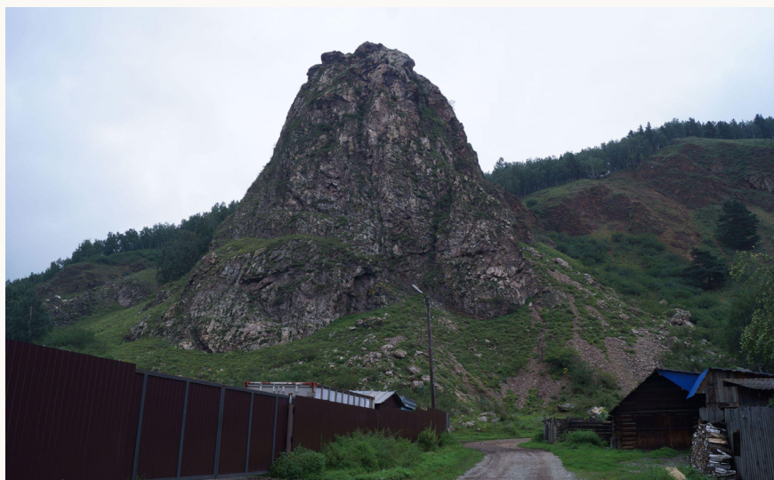
Рис. 2. Башня Умай (гора Хабас; фото автора; снято с ЗЮЗ)

Следует отметить, что из числа известных в Евразии находок предметов с изображениями Умай наиболее детализированные из них были найдены в результате наших раскопок в 1985 г. недалеко от места расположения этих горы и скалы (на расстоянии около 55 км к юго-западу) в кургане № 7 могильника Койбалы на Абакане, на серьгах из золота и серебра, изображавших крылатую женщину. Присутствовали также нимб над головой, чаша в руках на уровне груди (с освященным молоком), две ромбовидные привески (символизировали кин – футляр для хранения пуповин детей) с изображе-