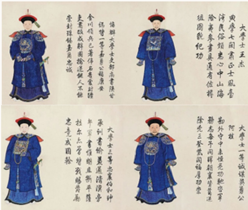
Рис. 5. Портреты свитка № 13–16 Fig. 5. Portraits of the scroll #13–16

Также на свитке имеются оттиски 21 разных красных печатей, принадлежавших владельцам, художнику и экспертам, в том числе как минимум четыре печати, принадлежавшие императору Цяньлуну и относящиеся к концу его правления – Гуси Тяньцзы 古稀天子 (Сын Неба в 70 лет) 12 , Тайшаньхуанди чжи бао 太上皇帝之寶 (Драгоценность отрекшегося государя) 13 , Уфу Удайтан гуси Тяньцзы бао 五福五代堂古希天子寶 (Драгоценность Сына Неба в 70 лет из Зала Полного счастья пяти поколений) 14 , Бачжэн мао нянь чжи бао 八征耄念之寶 (Драгоценность постигшего восемь способов познания человека в 80 лет) 15 .