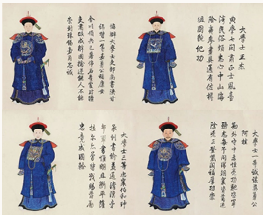
Рис. 6. Портреты свитка № 17–20 Fig. 6. Portraits of the scroll #17–20

изошедшего на Тайване в 1787–1788 гг. – Агуй, Хэшэнь, Ван Цзе, Фуканъань, Хайланьча, Фучжанъань, Дун Гао, Ли Шияо, Сунь Ши, Сюй Сыцэн, Эхуй, Шулян, Пхурбу, Цай Паньлун, Лян Чаогуй, Сюй Шихэн, Мукэдэнъа, Пуцзибао, Чжан Чжиюань и Мутар.